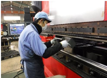
9) 曲げる順序も画面表示されていてストレスフリー!!