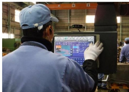
8) 曲げの微調整も数値入力で簡単に