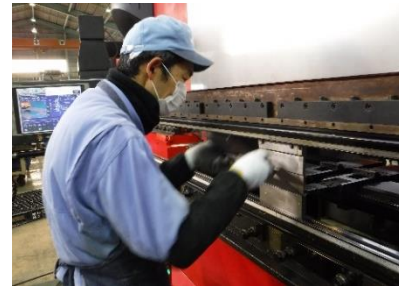
3) 上下の金型でプレス!!