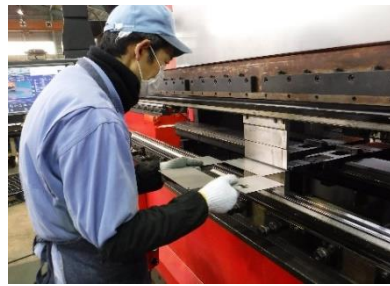
2) ゲージに突き当てて…