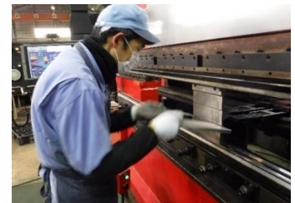
5) 作業者のペースで機械を動かして