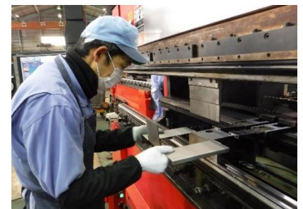
6) 慎重に且つ大胆に…曲げる