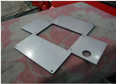
1) 曲げる前の板金(ワーク)